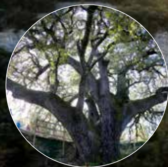
La Carrasca Milenaria de Lecina Árbol de Europa 2021 Coste del parking: 2 € 978 75 05 40

La cabecera del río Vero, a su paso por la Sierra de Guara, esconde un legado excepcional. Más de sesenta abrigos descubiertos con pinturas rupestres hacen de este lugar un verdadero museo donde pueden admirarse los tres estilos clásicos del arte rupestre europeo: Paleolítico, Levantino y Esquemático.