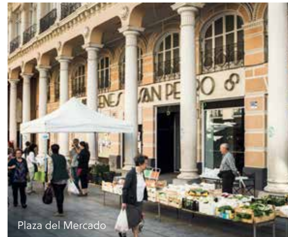
Plaza del Mercado